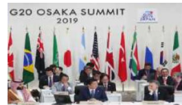
「大阪ブルーオーシャンビジョン」が共有されたG20大阪サミット(2019)の様子

国際共同観測による包括的な海洋観測網構築への貢献、海洋データの共有・活用、SDG14の実現に向けた日本モデルの推進(海洋プラスチックごみ対策等)、革新的技術の研究開発の推進 等