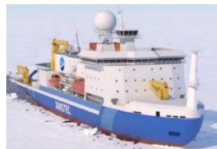
北極域研究船の完成イメージ図

北極域研究船の着実な建造、北極域研究加速プロジェクト(ArCS II)による観測・研究・人材育成の推進 等