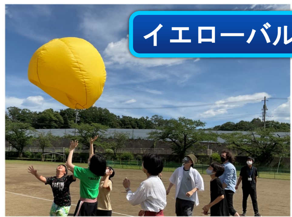
イエローバルーン