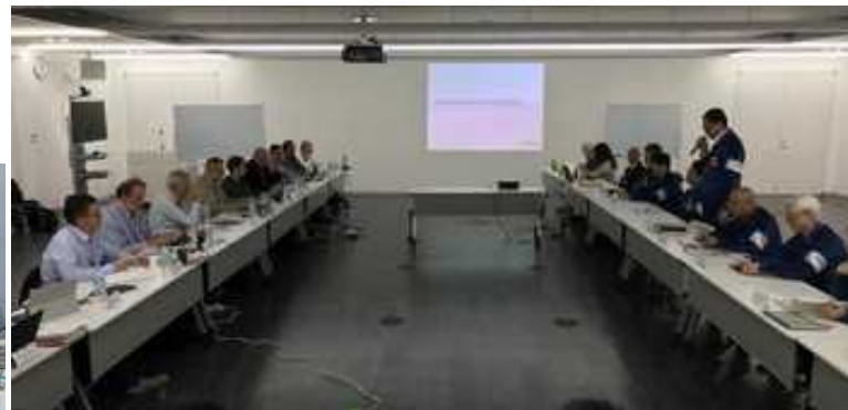
IAEAレビューミッション 発電所幹部との意見交換 (2018年11月)