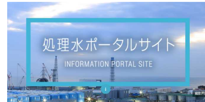
処理水ポータルサイト