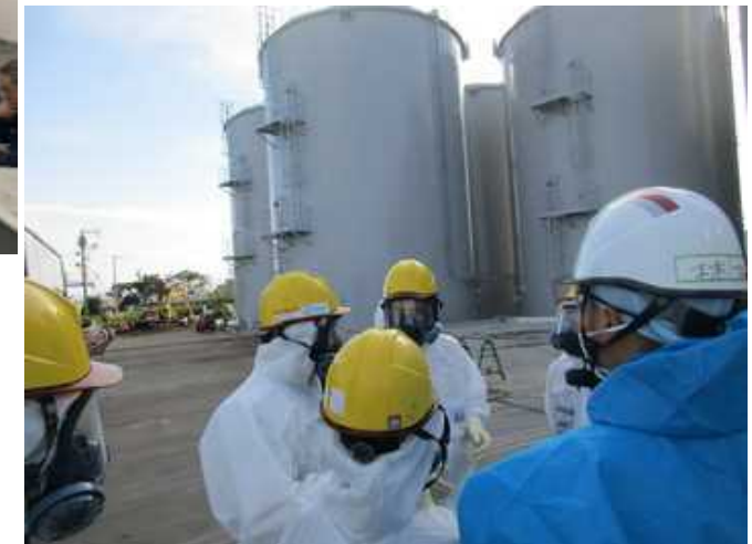
IAEAレビューミッション現場視察 (2018年11月)