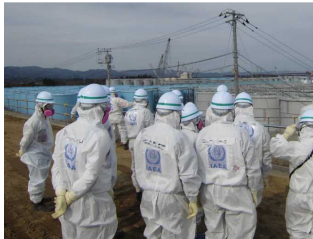
IAEAレビューミッション現場視察 (2015年2月)