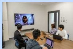
ICTによるコミュニケーション