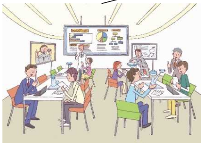
サイバー空間・ フィジカル空間の 融合による 新たな価値の創出