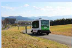
構内道路を活用した実証実験