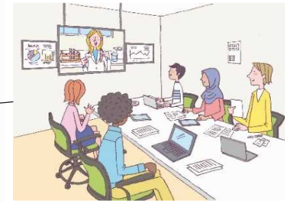
ニューノーマル時代の 国際交流