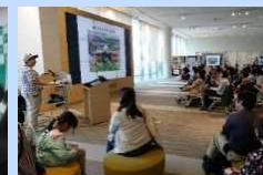
地域への公開講座