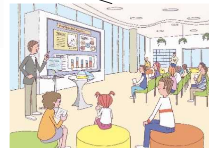
テクノロジー×地域資源 による地方創生