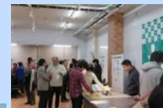
地元企業との交流会