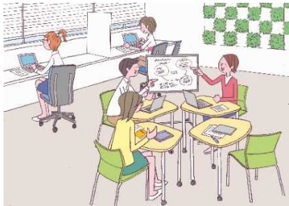
DXを活用した 新たな知の創造

⇒ 多様な学生・研究者や異なる研究分野の「共創」、地域・産業界との「共創」の促進等により、教育研究の高度化・多様化・国際化、地方創生や新事業・新産業の創出に貢献