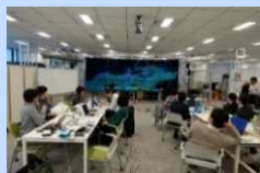
他大学や企業等とのオープン・ラボ