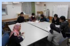
国際寮における日常的な国際交流