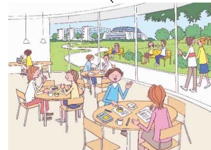
日常的な知的交流や 人間関係の形成