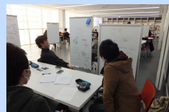
学生同士のアクティブ・ラーニング