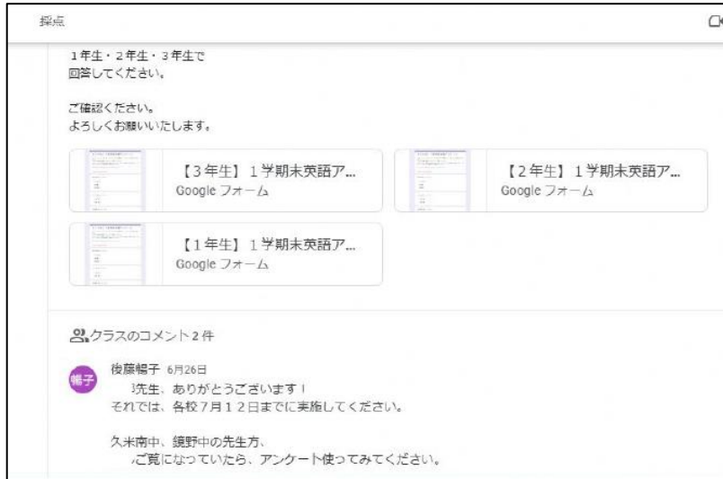
【資料を非同期で共有】