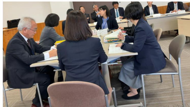
【定期的な合同教科会】