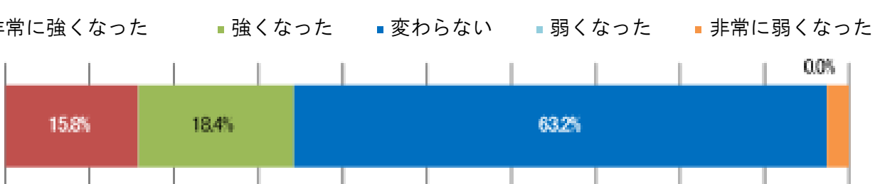
令和7年度 前期 教育実習調査 (中学校) 学部4年生