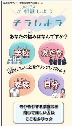
※市長部局と共同で作成した相談窓口を検索できるツール「こまったときは 相談しよう そうしよう」