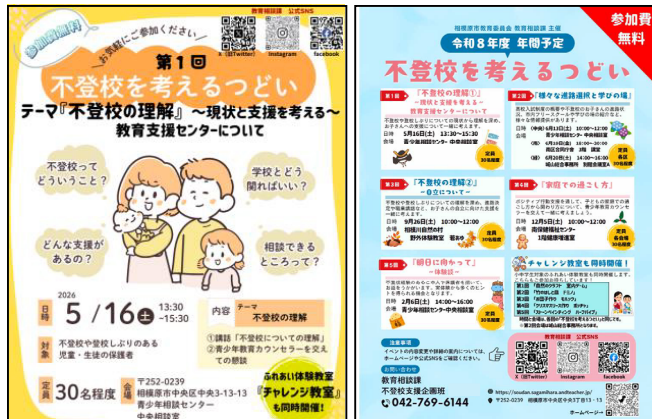
※不登校を考えるつどい

本アクションプランは策定して間もなく、実行期間は始まったばかりですが、「誰一人取り残さない」という思いのもと、全ての子供と保護者が、安心して未来を描けるよう本市一丸となって進めてまいります。