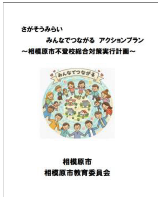
※令和8年1月に策定した「さがそうみらい みんなでつながる アクションプラン～相模原市不登校総合対策実行計画～」

社会とのつながりを途切れさせないことは、学校だけで取り組めるものではなく、福祉や地域等の関わりも欠かせません。そこで、このアクションプランは、教育委員会だけでなく、市長部局と連携し、市全体で不登校対策を進めていくものとしています。