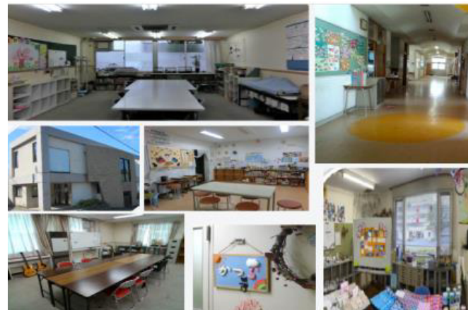
※校外教育支援センターの様子

今後は、令和11年4月に開校を予定している学びの多様化学校の設置やメタバースを活用した学びの場の整備などにより、子供たちの学びの場の選択肢を増やすとともに、地域住民等による居場所づくり活動の更なる支援により、地域の居場所の拡充を進めていきます。