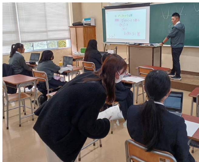
写真1 少人数学級編制と学習支援員

1学年には40名が在籍しますが、大人数を苦手とする生徒への配慮として、1クラス20名の少人数学級編制で、各クラスに担任、副担任を配置しています。入学1年目の国語、数学、英語については、40名を3つのグループに分割して習熟度別授業を実施しており、生徒の学習到達度に合わせた学習指導に取り組んでいます。