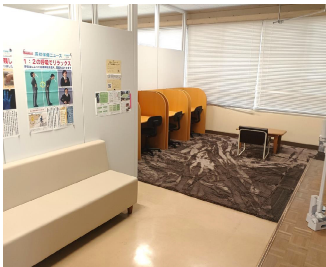
写真4 リラックスメールーム

職員室の横にリラックスメールームを設けています。気持ちを落ち着かせるための部屋で、絨毯、ソファ、パーテーション付きのデスクなどがあります。教室で授業を受けられない場合は、リラックスメールームでオンライン授業を受けることもできます。