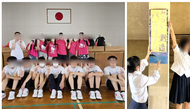
写真5 コース独自の学校行事

生徒アンケートの結果、修学旅行に対して肯定的な意見が多かったため、高校2年生にあたる年次を実施することを計画しています。秋季休業中に実施することで、参加しない生徒が欠席扱いにならないよう配慮します。