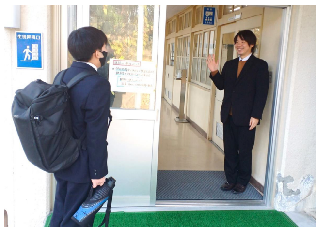
写真3 コース専用の昇降口

コースの生徒専用の昇降口を設けています。時制(始業時間が遅く、終業時間が早い)や教室の配置も含め、コース以外の生徒と動線や活動エリアが重ならないよう工夫しています。