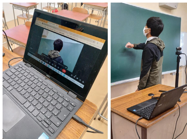
写真2 ICTを活用した学習支援

体育等の実技系の授業を含め、ほとんどの授業をオンラインでリアルタイム配信しています。自宅でも授業に参加できるため、登校できないときも学習の遅れが生じにくく、「勉強についていけないから登校したくない」という状況ができるだけ発生しないようにしています。