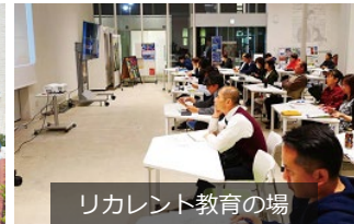
リカレント教育の場