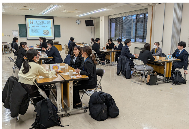
第1回 初任者研修「しゃべり場」の様子

時間設定も放課後の時間帯の40分間という短い時間でしたので、最初の5分程度で会の目的を説明し、初任者同士の話す時間を35分間とりました。話合いのテーマは、「先生になって、どうだった?」とし、フリートークとしました。作成したチラシ（図2）も配付し、教育委員会は困ったことがあったら、すぐに駆け付けることをアピールしました。