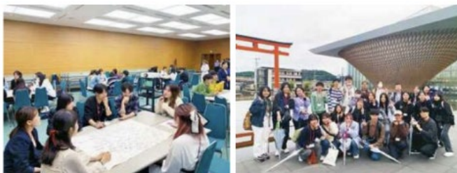
（東アジア文化都市学生フォーラムやフィールドワークの様子）

「学生が考える東アジア地域の文化と文化交流」をテーマに、日中韓の学生交流を通じて三国間の理解促進を図るとともに、新たな大学・学生間の交流の創出を目的に、中国及び韓国から大学生を招聘し、県内の日本人学生や留学生を交えたフォーラムやフィールドワークを開催。（参加者数：87人）