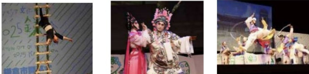
（日中韓文化芸術祭における公演の様子）

鎌倉市における東アジア文化都市の開幕式において日中韓文化芸術交流祭を開催（第1部：開幕式典、第2部：日中韓文化芸術交流祭）。各都市による特色ある伝統芸能が披露され、文化交流の理解促進につながった。（来場者数：750人）