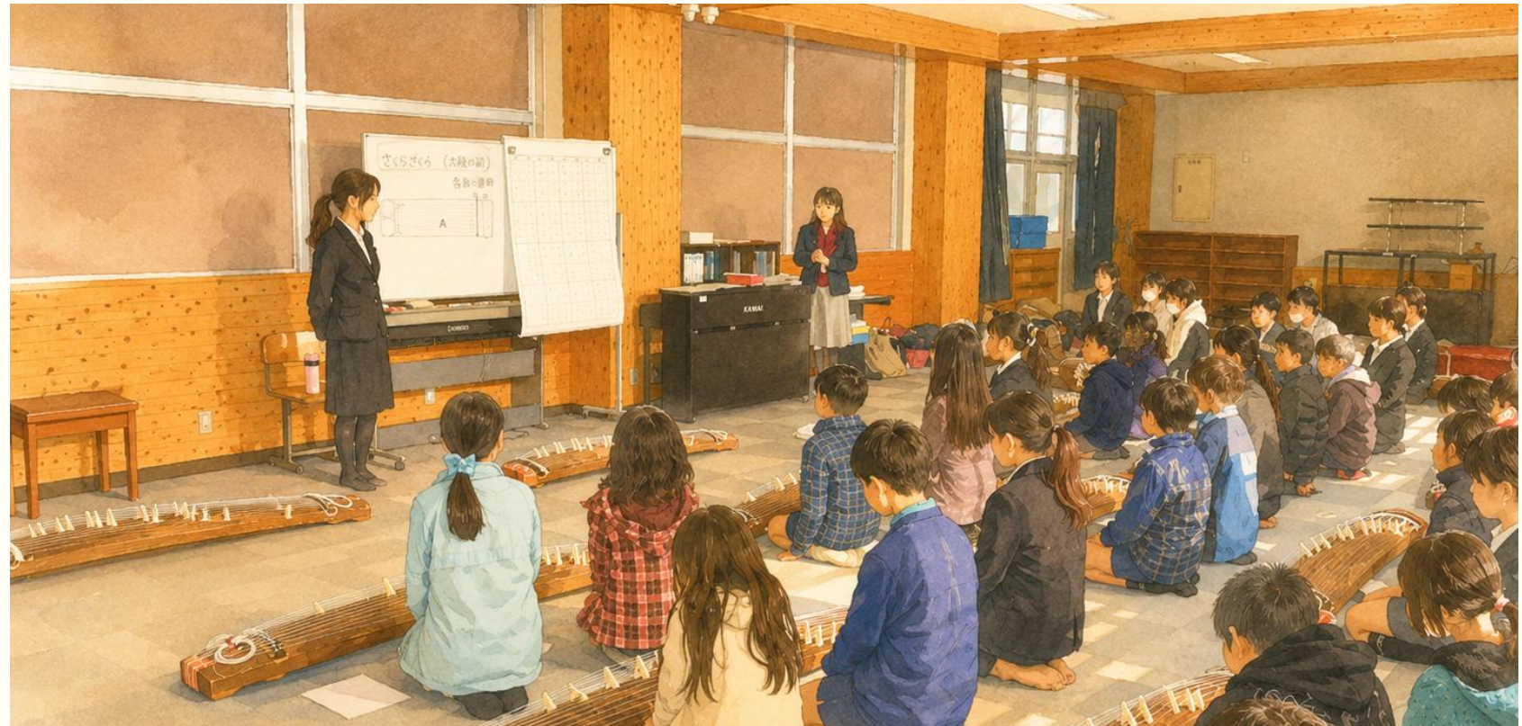
小学校での箏合奏指導 (静岡市内の小学校)