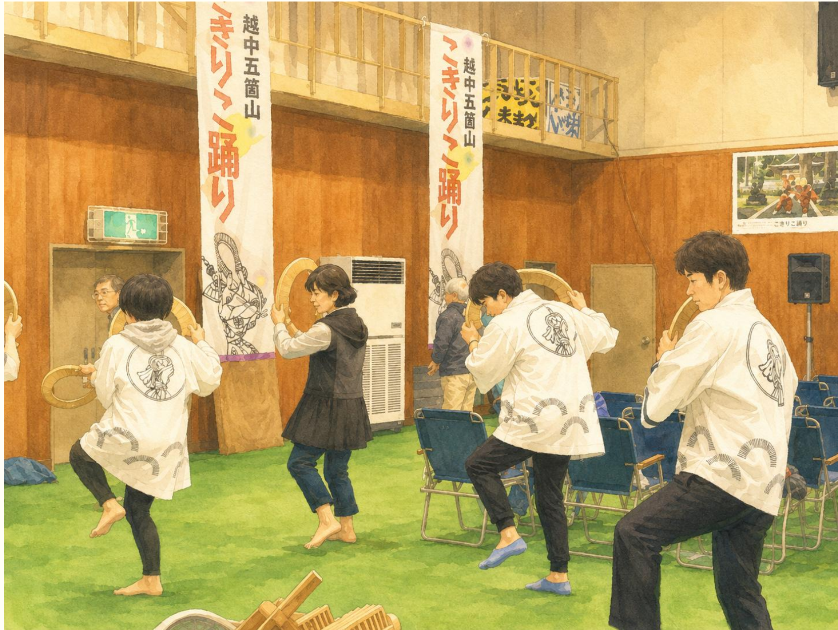
五箇山・こきりこ祭りでの「こきりこ」学習 (指導学生と保存会)