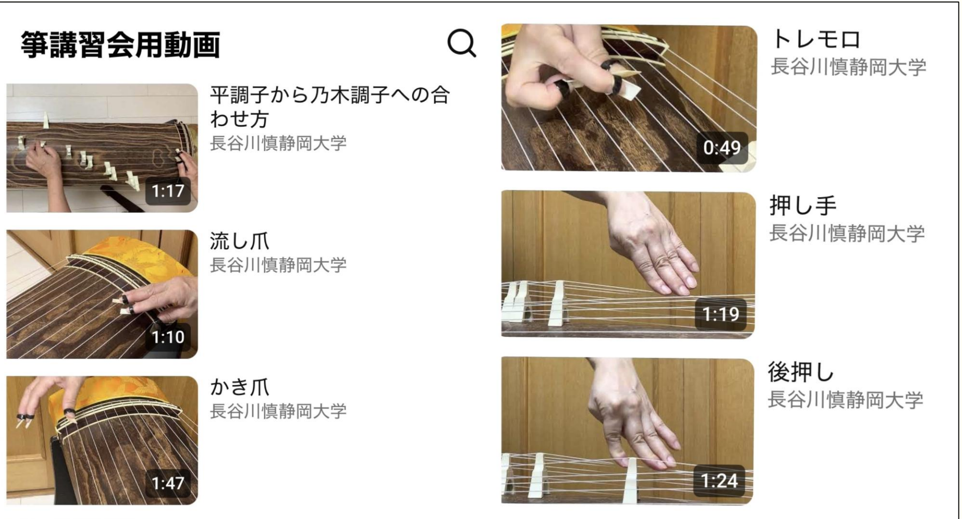
学習者が箏の奏法を主体的に学ぶための動画サイトの活用 (発表者制作)