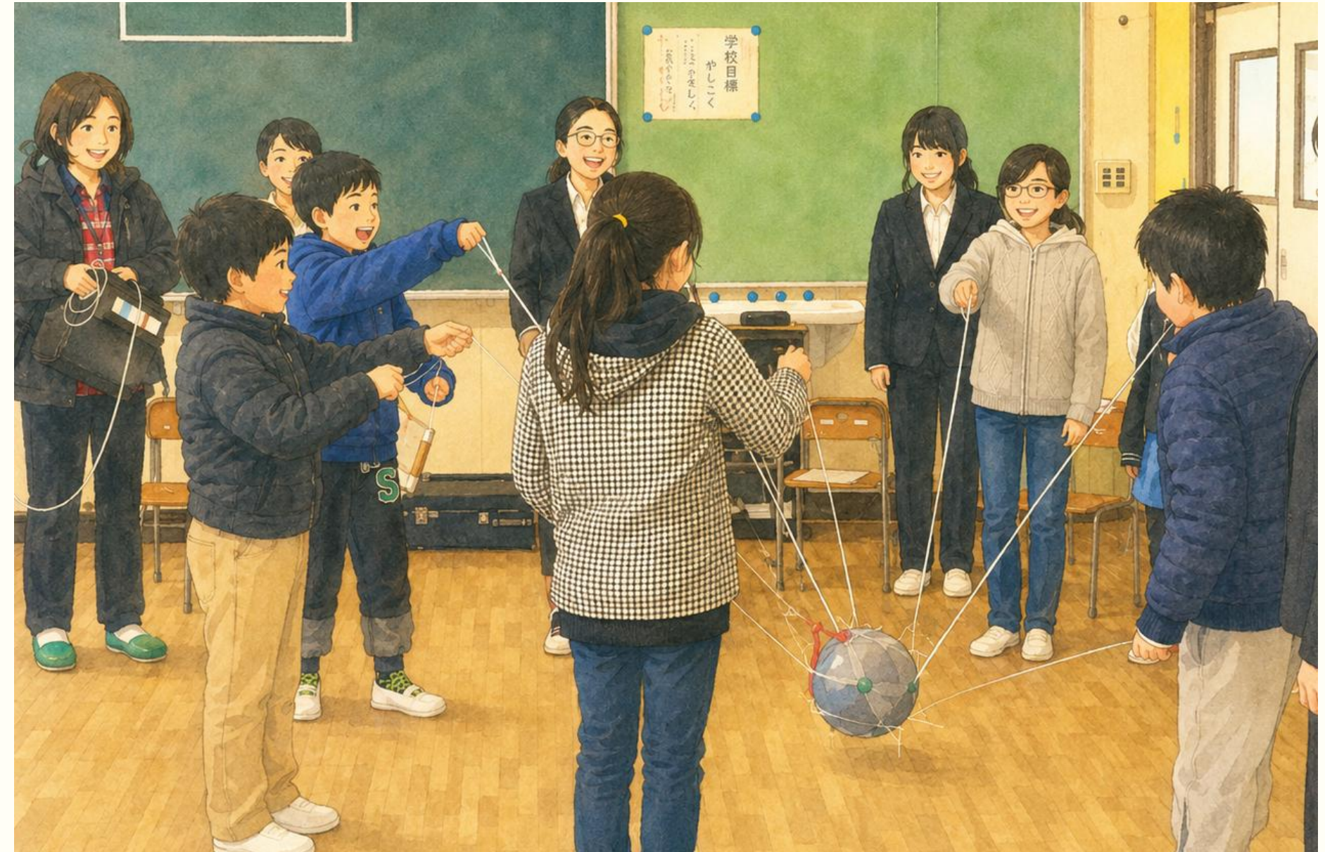
《駿河地搗き唄》を大学生が小学生に伝授 (静岡市内の小学校)