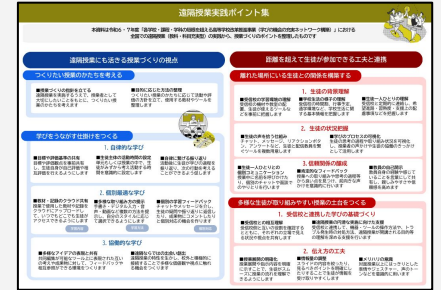
▲遠隔授業実践のポイント集