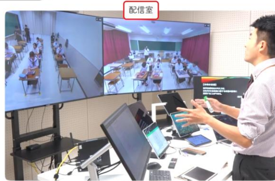
遠隔教育配信センターにある配信室には多くの機材が整備されています