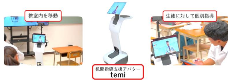
個別指導が可能な temi を使って一人ひとりの生徒をサポートするという取り組みもしています