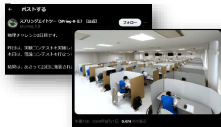
SPring-8を会場とした物理チャレンジ (X公式アカウントの投稿より)