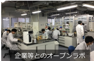
企業等とのオープンラボ