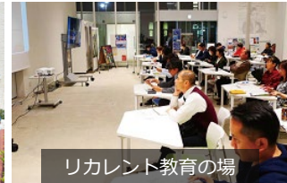
リカレント教育の場