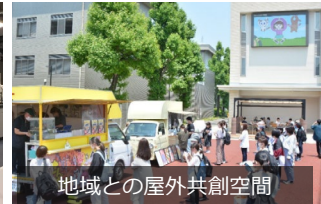
地域との屋外共創空間