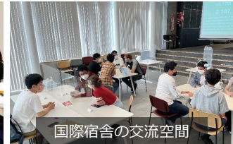
国際宿舎の交流空間