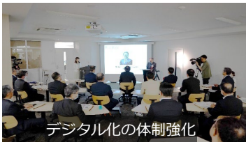
デジタル化の体制強化

イノベーション・コモンズ：キャンパス全体が有機的に連携し、ソフト・ハードの取組が一体となり、あらゆる分野、あらゆる場面で、あらゆるプレーヤーが共創することで、新たな価値を創造できる拠点