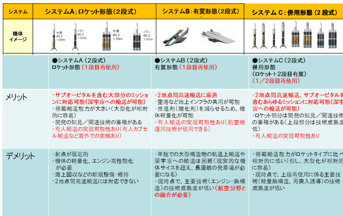
表2 将来宇宙輸送システム飛行形態例の特徴比較