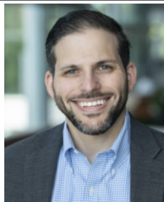
ロードアイランド州教育省 (RIDE) イノベーション・改善・データ部門チーフ