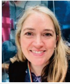
教育省 教育関与・就学支援・福祉担当課長