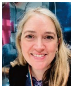
教育省 教育関与・就学支援・ 福祉担当課長

イングランド全土における学校出席率の向上に関する教育省の取組を統括。また、入学制度、通学支援、放課後保育、行動支援、停学・退学、学校給食、ライフスキル教育など幅広い分野を所管。すべての子供たち一特に弱い立場にある子供たちが、落ち着いた支援的な学校環境のもとで教育に十分に参加できるように支援している。