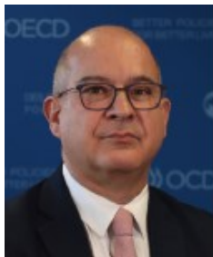
経済協力開発機構 (OECD) 教育・スキル局 政策助言・ 実施課長