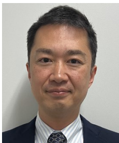
文部科学省 初等中等教育局 児童生徒課長

2002年文部科学省入省。以後、初等中等教育局・高等教育局、福岡県教育庁、在ジュネーブ国際機関日本政府代表部、東京オリンピック・パラリンピック担当大秘書官などを担当。2023年、不登校対策「COCOLOプラン」の策定に参画。2024年4月より現職。不登校やいじめなど生徒指導に関する政策を担当。