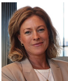
ノルウェー教育訓練局 教師能力開発課 幼稚園・ 学校環境担当課長

2018年より教育訓練局に勤務。教育現場において20年以上の経験を有し、教師および学校リーダーとして従事。不登校の予防および対応に関する国家レベルの専門指針の策定に参画。長年にわたり、幼稚園や学校が安全で良好な教育環境を整備するための支援を行う学習環境プロジェクトを主導。また、学校や放課後プログラムが安全で良好な環境づくりに取り組む際に活用できるデジタル能力開発パッケージの開発を指揮。