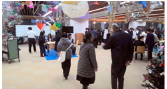
写真4 「よりみちカフェ」の様子

催し、いくつかの実践も行っている。例えば、軽井沢中学校では、「友達と休憩したり交流したりできる場所」や「自分たちが楽しめる行事やイベント」等を望む意見が多くあったため、PTAや地域住民、町教委の協力を得ながら、生徒自身が「カフェ」を企画立案し実現させた。当日は多目的室を「よりみちカフェ」（写真4）と名付け、ボードゲームや飲料の提供など6つのブースを設け、来場者に自由に立ち寄ってもらった。当日来場した地域住民やPTAからは「とても良い取組だった」等の好評をいただき、実行委員の生徒からは「自分たちが考えたことや提案したことが、実現でき、やりがいを感じた」等、手ごたえを感じた様子だった。