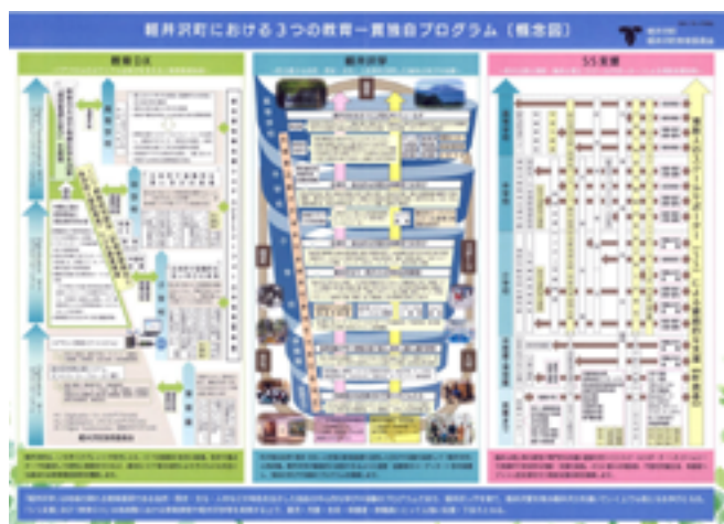
図1 三つの教育一貫独自プログラム（概念図）

当町の教育を進める姿勢を、早春に純白の花を咲かせる町木にちなんで「こぶし教育」としており、そこでは幼保小中高の連携や軽井沢の資源を活用した教育や軽井沢学の推進などを謳った七つの基本方針が示されている。この基本方針を具体化するための三つの教育一貫独自プログラムの概念図（図1）を町教委として令和6年度末に作成した。