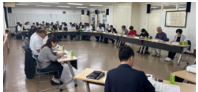
写真3 軽井沢オープンドアスクール（仮称）設置準備会議

令和9年4月開校を目指して、設置準備会議を組織し、令和7年3月から令和8年3月まで七回の設置準備会議が開催された（写真3）。令和8年度には既存施設の改修を行い、学校施設の準備や学校説明会など、生徒募集に向けて準備を進めている。