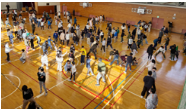
写真2 全小学校5年生合同の授業

令和7年度は対象を拡大して5年生の他、継続して6年生も対象とし、昨年より1回多い、年間6回、合計12時間分とし、最後の1回は全小学校5年生、6年生がそれぞれ全員、軽井沢中部小学校に集合する授業とした（写真2）。さらに小学校の先生方だけでなく、当町の小学生の多くが進学する軽井沢中学校の先生方にも2時間程度の教員研修を行った。