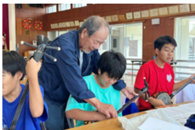
講師が指導する様子

現在では、伝統文化学習をきっかけに三線や舞踊に興味関心を持ち、芸能を学ぶ子どもたちも増えました。