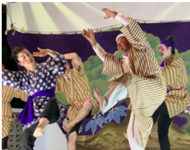
野甫区の豊年祭の様子

本村の伝統行事は1年を通して様々な催しがあり、我喜屋地区で行われる綱引きや田名区では海神をお迎えし、豊漁を祈願して行われるウンジャミ、子どもの健康祈願のシヌグ行事などがあります。そのうち、各集落では旧暦8月11日から豊年祭が行われ、老若男女が五穀豊穡を願い芸能を奉納します。この時期になると、毎夜披露する踊りの練習や棒術の練習などで公民館は活気に満ち溢れています。