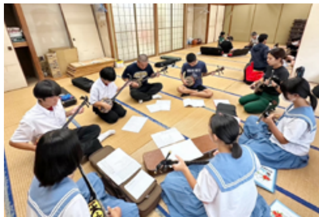
先生と生徒と一緒に練習

しかし、伝統文化学習の取り組みを継続して行っていく中で、多種多様な教室を実施しているため、課題がみられるようになりました。1教室に1講師を設定している教室は、高齢の講師は通院のため休む場合や、モズ