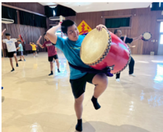
小学生から中学生と一緒に教員が練習する様子

この取り組みで児童生徒の管理を行っていた学校は、地域の伝統文化をともに学ぶ教員が増え、ともに学ぶ姿勢は相乗効果を発揮し、子どもたちの意欲を引き出しています。