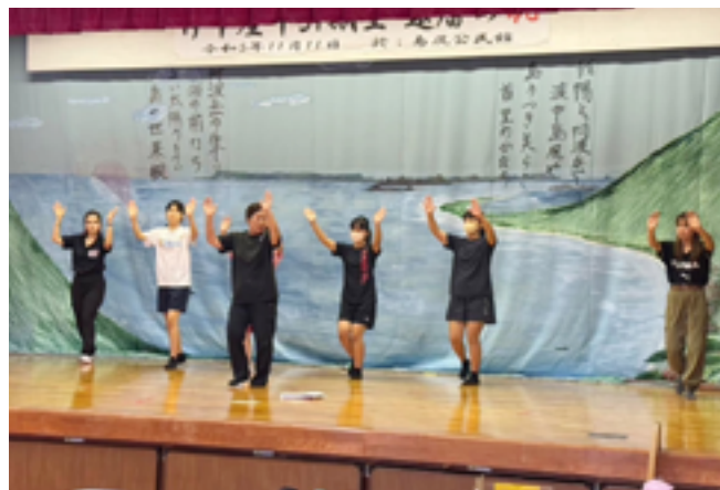
地域講師による指導

教室を開講する地域の先生方は、とても熱心に児童生徒へ指導していただき、教室では講師として、地域にかえれば地域のおじちゃんおばちゃんとして、伝統文化学習の日を通じ、世代を超えた世代間交流がうまれています。