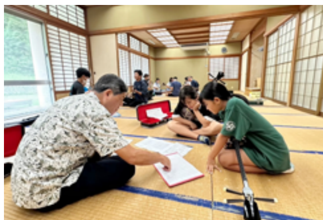
校長が指導する様子