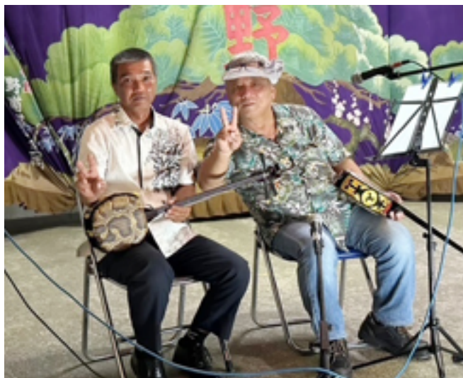
豊年祭で駆けつけた応援の演奏者

三線などはすぐに習得出来るものではなく、日頃から練習を行う必要があり、当時は三線を習う教室を開講していない状況でした。