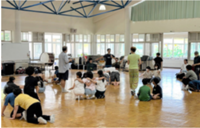
写真1 「表現コミュニケーション」の一場面

事後に1回、管理職や担任の先生方とファシリテーター等が打ち合わせを行い、指導案を作成し、事後には振り返りシートの作成と共有を行った。