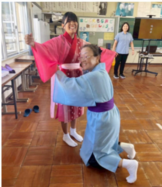
練習前に着付けを行う

この取り組みで児童生徒の管理を行っていた学校は、地域の伝統文化をともに学ぶ教員が増え、ともに学ぶ姿勢は相乗効果を発揮し、子どもたちの意欲を引き出しています。