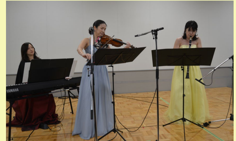
アンサンブル演奏