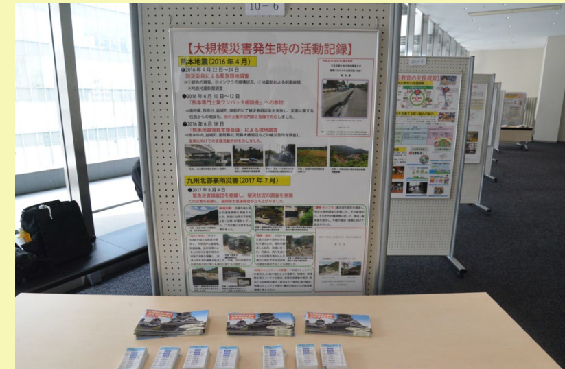
ホワイエの技術展示 (10/26)