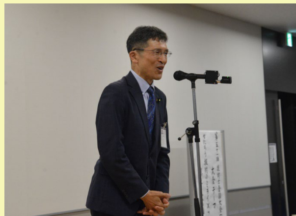
新妻技術士ご挨拶