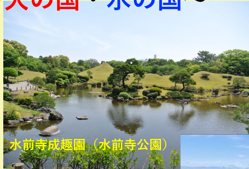
水前寺成趣園（水前寺公園）