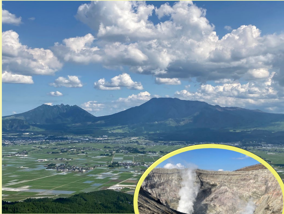
阿蘇火山群・涅槃像