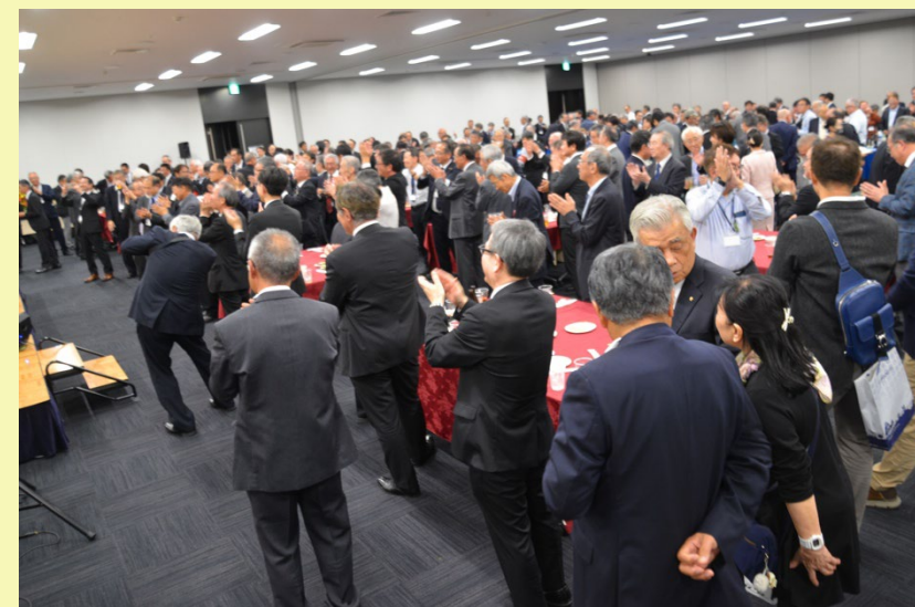
会場の様子（355名参加）