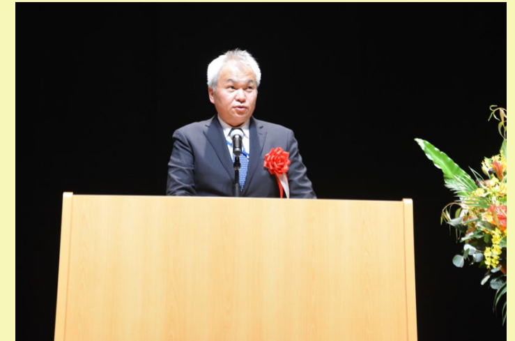
祝辞（福井大臣官房審議官）