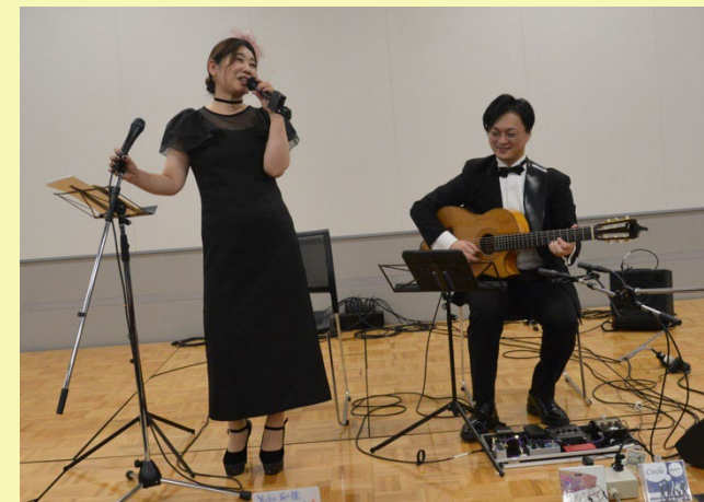
Vocal & Guitar演奏