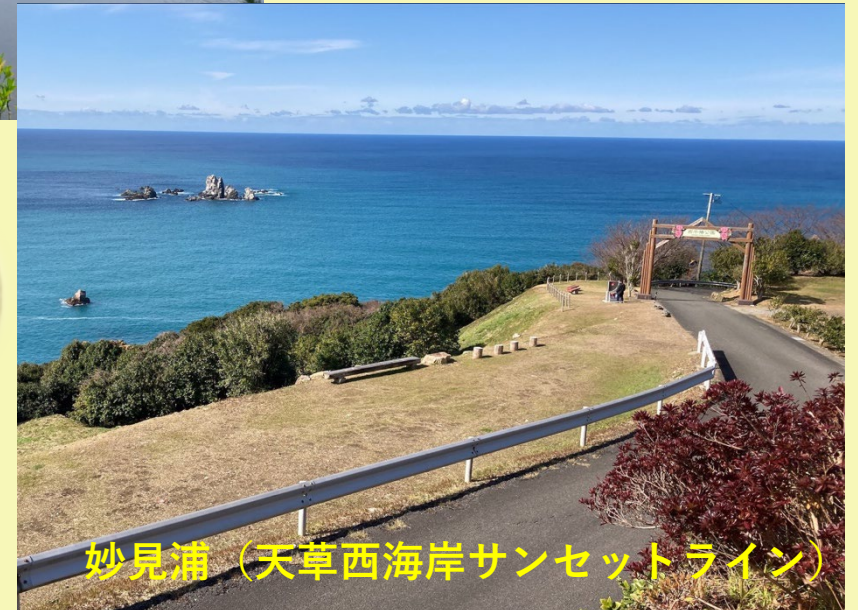
妙見浦（天草西海岸サンセットライン）