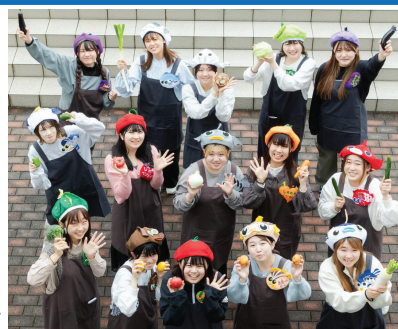
野菜帽を被って「野菜摂取・朝食摂取向上」に取り組む「しのめベジガール」

「卒業研究」の一つである「しのめベジガール」活動では、県民の野菜摂取・朝食摂取向上に取り組む中で「主体性の育成」に有効であることが示唆されたため、学科内で地域での産学官連携を積極的に推進しています。活動は寄付金等で賄われ、学生はレシピ考案・試作・評価・改善・企業との打合せを通じ、「活動していくうちに自信がつき、自ら積極的に行動できるようになりました。」「他者と連携・協働し最後までやり遂げる力が身につく等、栄養士として働く上でプラスになる多くの刺激的な学びができました。」と変動する社会で活躍できる資質の鍛錬を図れているようです。リメディアル教育や試験対策により、栄養士実力認定試験でも令和3年度より4年連続で全国表彰者（令和4年度は全国1位（満点）の成績優秀者1人）を輩出しています。