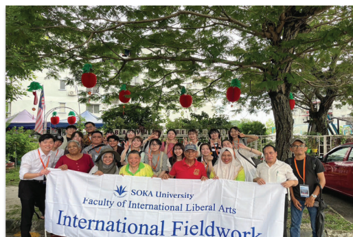
国際研修：International fieldwork参加者（2024年2月）

教育の質向上に特化したEnglish Medium Program (EMP)を導入し、入学前教育、オリエンテーション、ゼミ、卒業論文指導の全過程を英語で実施しています。この徹底した語学教育の環境は、学生の飛躍的な英語力向上に大きく貢献しています。さらに、学部開設当初より1セメスターの海外留学を必修化し、実践的な国際経験を重視。1年次から4年次までの一貫した少人数ゼミ教育と英語による卒業研究指導をしています。また、段階的な国際研修と留学機会を豊富に提供することで、学生たちは日本では経験できないような事象を目の当たりにすることで、世界の社会問題を肌で感じ、自身の将来について世界も視野に考えるきっかけを得ています。そして、多様な背景を持つ学生たちが互いに学び合い、国際的視野と課題解決能力を養います。