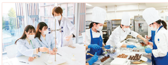
食品衛生学（実験・実習）授業風景

本学科では、実践力を育むための丁寧な教育体制を整えています。学科助手は現場経験を持つ本学科の卒業生が務め、実習のサポートや進路相談など、学生に寄り添った支援を行っています。卒業生からの評価では、「先生や助手の方が話しかけやすかった、助けになった、共感してくれた」が94.3%と非常に高く、「疑問や進路については先生に相談すると、とても親身になって話を聞いてくれる」との声もありました。授業前後には学習プラットフォームを活用して、学びの定着を支援しています。実習科目では、デモンストレーション動画を配信し、事後学習のレシピ作成に役立てています。実験科目では、事前に実験内容のシミュレーションを行い、仮説を立てることで理解を深めています。また、販売実習においては、接客態度や販売オペレーションについて、学生自身による振り返りと、教員からの評価・助言をプラットフォーム上で公開・共有することで、学生同士の学び合いを促し、協働的かつ主体的な学修を実現しています。