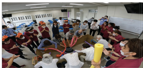
模擬デイサービスでの棒サッカーの様子 チームメンバーが一列に並んで走り、相手チームと対峙して左右どちらかの自チームのゴールを目指してボールを奪って打つという動きを繰り返すというゲームルール

「模擬デイサービス」とは、医学教育の模擬患者から着想したもので、模擬利用者に学生がデイサービスを行うものです。模擬利用者には、学生の教育に協力してほしいと地域住民に依頼しています。模擬といえども本物の「お客様」なので、学生は大変な緊張感のもと本気で応援し、模擬利用者もそれに応えるという、「応援の相互作用」が生まれています（右の写真は、模擬デイサービスでの棒サッカーの様子です）。その後、学生と住民は挨拶を交わしたり、住民が地域行事に学生を招待するなど、地域と良好な関係を構築できています。住民の模擬デイサービスへの参加は、学生の応援による自己肯定感の向上や介護について考えるきっかけにもなっています。学会発表や研究論文を通して、この取り組みの成果を発表しています。