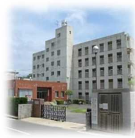
国際交流会館(西町)