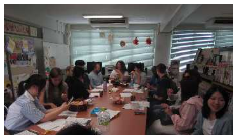
学生交流のイベント「なっきょん's café」（2025年の場合）