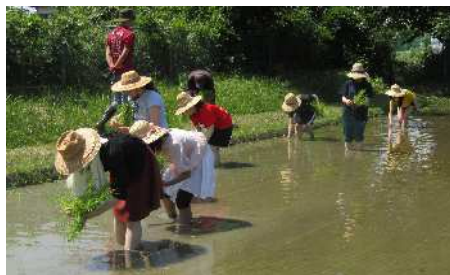
国際交流イベント「田植え体験」（2025年の場合）