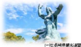
（一社）長崎県観光連盟 平和公園の平和祈念像

長崎県下の新規渡日留学生を参加対象とした終日のイベント。被爆者による講話を聞く機会を設け平和公園、原爆資料館、長崎歴史文化博物館を回るなど平和について学習する。