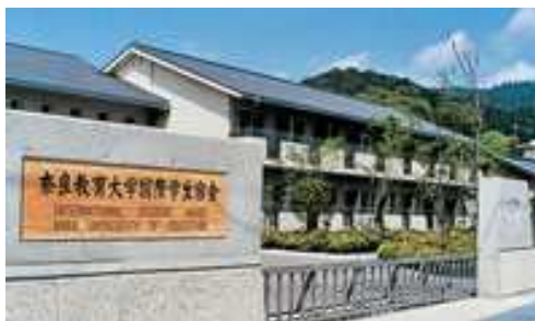
本学国際学生宿舎