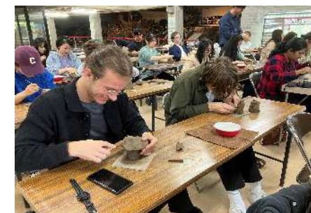
和歌山学習旅行（2024年の場合）