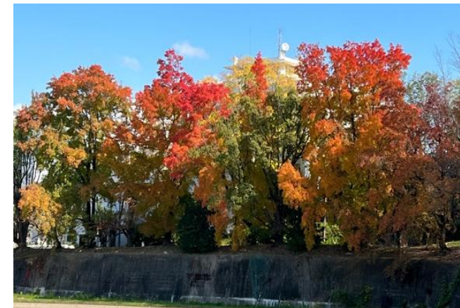
キャンパス内のフウノキの紅葉

https://www.kyokyo-u.ac.jp/student/ehp/to-this/ttp/post-1.html