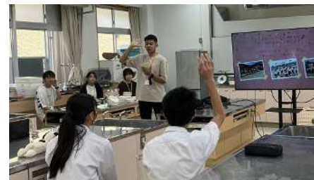
小中学生対象のサマースクールin 曾爾への参加 （2023年度の場合）