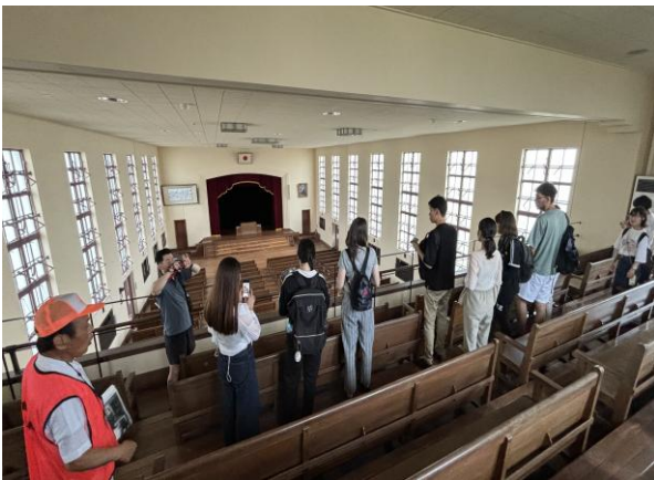
国際交流実地見学研修（アニメのロケ地になった 滋賀県の施設にて）

日本人学生と年1回の実地見学研修に行きます。また、京都市国際交流協会主催の国際理解プログラムPICNIKに参加すると、地域の学校を訪問して、自分の国の紹介を行いながら、子ども達と交流することができます。