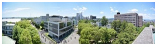
三重大学 上浜キャンパス