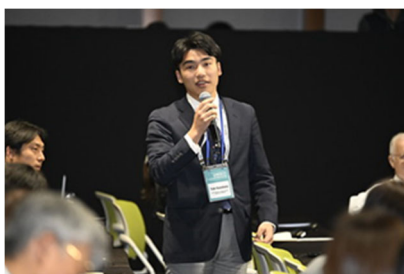
発言する川端次世代委員