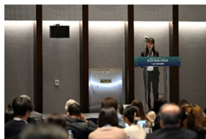
2024韓国ユネスコASPnetギャザリングでの職員の発表