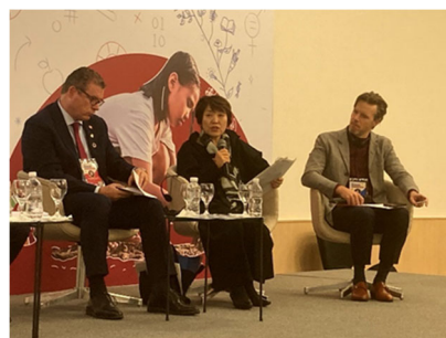
あべ大臣の登壇の様子