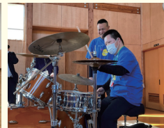
みしゃモンカレッジ