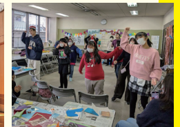
春日井子どもサポート KIDS COLOR