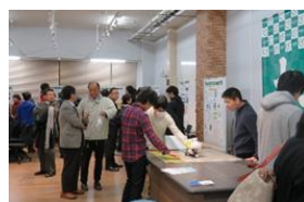
学生と起業家・地元企業との交流を促進する共創の場