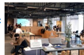
国内外の大学や企業との連携拠点