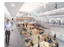
研究者間の連携を促進する最先端研究の拠点