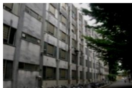
落下の危険がある外壁