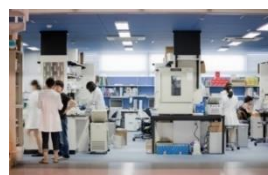
フレキシブルなオープンラボ