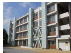
老朽改善された施設