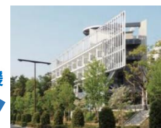
県や市と連携して地域防災支援を行う活動拠点