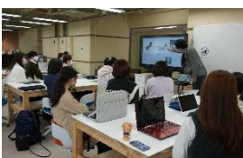
イノベーション人材育成のための教育環境