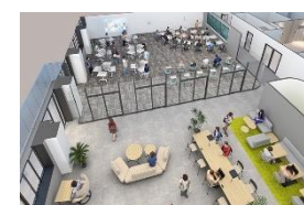
産官学連携による地域の課題解決の拠点