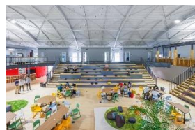
体育館をリノベーションしたコワーキングスペース、スタートアップ創出拠点