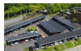
創エネルギー設備の整備