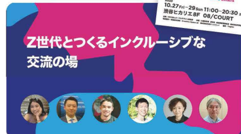
シンポジウム②(令和5年10月28日実施)