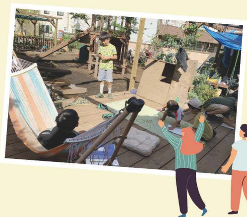
常設の冒険遊び場 八王子冒険遊び場の会HPより

今年度は2校(都立鹿本学園、都立八王子西特別支援学校等)で開催され、子供や保護者等、およそ1,900人が来場しました。特別支援学校に通う児童、近隣の小学校、幼稚園・保育園等に通う園児・児童や地域に住む子供たちが、障害の有無に関係なく、思いきり遊んでいる姿が見られ、共に楽しむ「インクルーシブな遊び場」が創出されました。この「移動式冒険遊び場」は、以下の2団体に依頼し、実現しました。