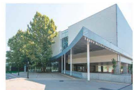
都立多摩図書館(外観)