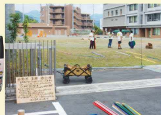
校庭に遊び道具を配置