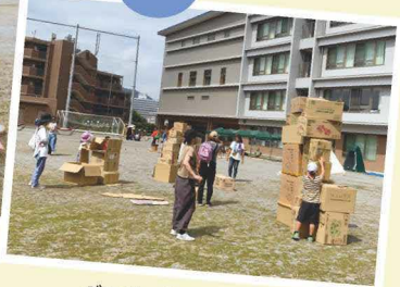
ダンボールを使った遊び

特別支援学校の校庭で健常の子供たちが遊んでいること、そして健常の子供たちと障害のある子供と一緒に遊んでいるのはとても大事なことなので、今後も是非続けてほしいです。