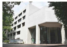
都立中央図書館(外観)

東京都立図書館ホームページ： https://www.library.metro.tokyo.lg.jp/