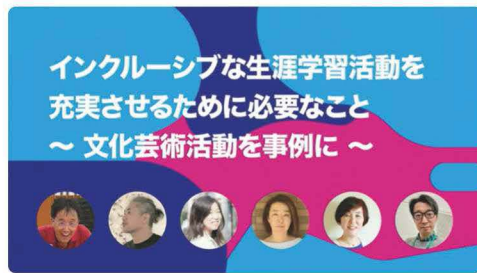
シンポジウム①(令和5年10月27日実施)

超福祉の学校(URL: https://peopledesign.or.jp/school/ )の中で、共生社会コンファレンスを開催。全国各地の教育・生涯学習・学ぶ・働く等々に関する具体的なアクションや最新事例を、渋谷からオフ&オンラインで全国に発信。オンタイムで参加できない方や渋谷まで来られない方も、場所と時間を飛び超えて、いつでもどこからでも参加できるイベントです。令和6年度については、2テーマでシンポジウムを実施しました(以下の二次元バーコードから、YouTube上で視聴できます。)