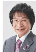
尾木 直樹 氏