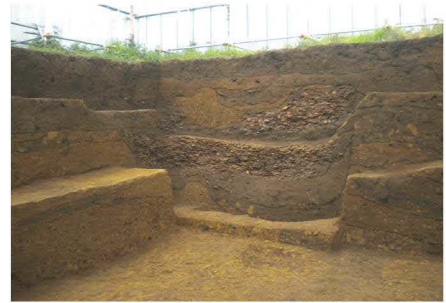
文京区原町西遺跡2号遺構