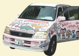
プレーカーから 遊び道具を搬出

「移動式冒険遊び場」実施当日の朝、遊び道具を満載したプレーカーが校庭に到着。校庭全体を活用し、ダイナミックに遊べる「動」の遊び空間と、ゆっくりすごしたり集中して創作したりする「静」の遊び空間を、緩やかにゾーニングするなどの工夫を凝らして遊び場を創り上げます。