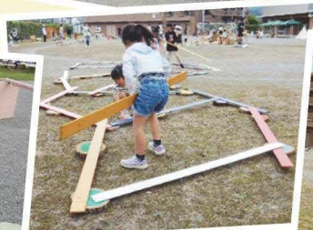
間伐材や木の板を用いた遊び