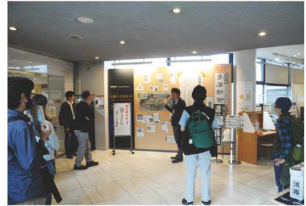
令和5年度企画展示 解説会の様子

問合せ先 東京都埋蔵文化財センター 広報学芸担当 (平日のみ 9:00～17:00) 〒206-0033 東京都多摩市落合1-14-2 電話：042-373-5296 ホームページ： https://www.tomaibun.jp/ アクセス：京王線・小田急線・多摩モノレール「多摩センター駅」下車 徒歩5～7分