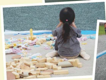
洗濯バサミも遊び道具に