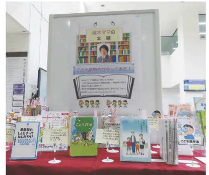
都立中央図書館の「尾木ママの本棚」の様子

問合せ先 東京都立中央図書館 〒106-8575 東京都港区南麻布5-7-13 電話：03-3442-8451(代) アクセス：東京メトロ日比谷線「広尾」駅下車徒歩8分