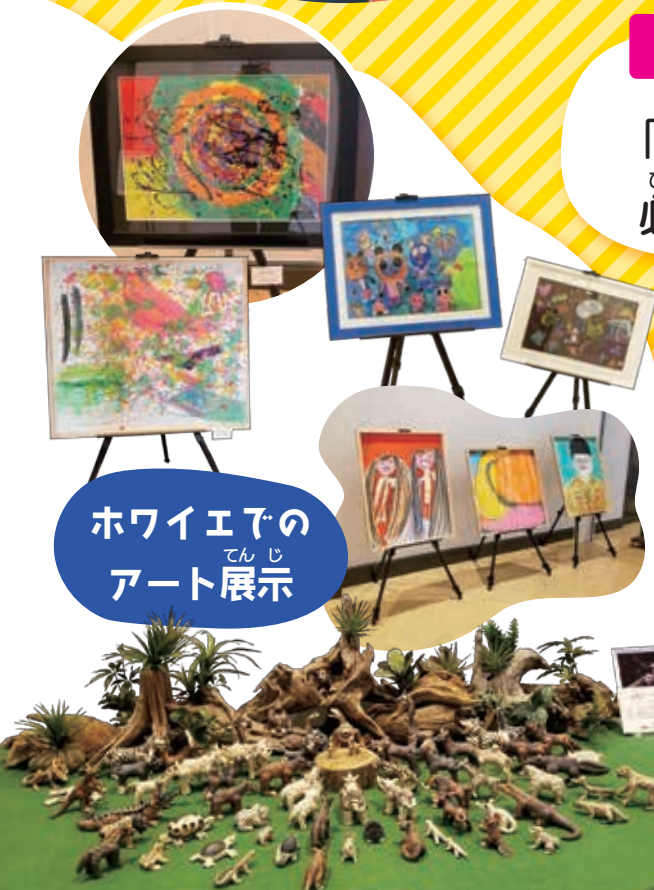
※写真は昨年度の様子です。