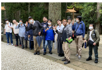
やりたいこと講座