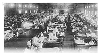
▲10章(15) 感染症に立ち向かう p276~277