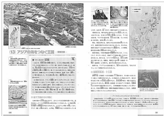
▲3章(13) アジアの海をつなぐ王国 p80~81

背景となる世界史を充実させ、日本と世界の歴史や文化が相互に深く関わっていることを考察し、歴史に見られる文化や生活の多様性に気付くことができるように構成しました。