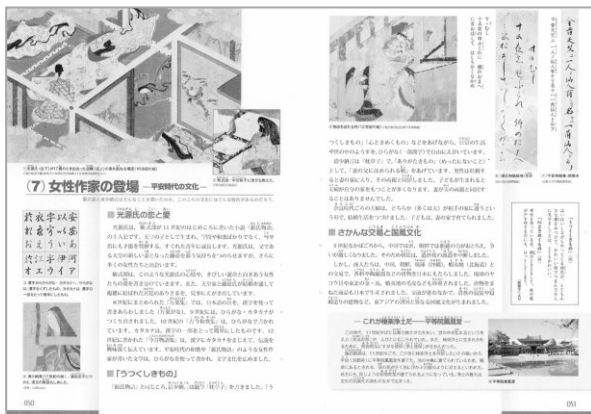
▲2章(7)女性作家の登場 p50~51

文化遺産や作者の名前だけに止まらず、文化を生み出した人びとの願いと社会の状況、文化を継承していった人びとの営みなどを具体的に描き出しました。