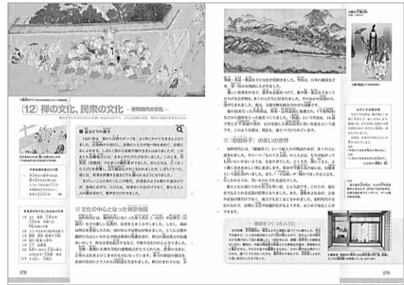
▲3章(12)禅の文化、民衆の文化 p78~79