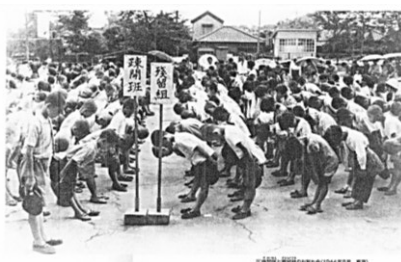
▲9章(12) 町は火の海 p236~237

近・現代史学習に、5つの章で61テーマを設定しました。第二次世界大戦後の現代史学習は、21世紀までテーマを設定し、生徒自らが歴史的事象を今日の社会と結びつけ、よりよい日本の社会と世界の実現を視野に、さまざまな社会の課題を主体的に追究、解決しようとする態度を養えるようにしました。