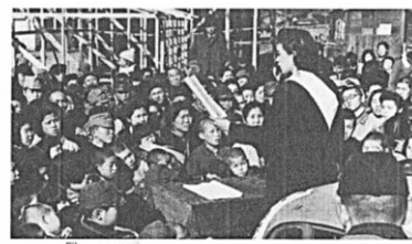
▲10章(1) 焼け跡からの出発 p248~249