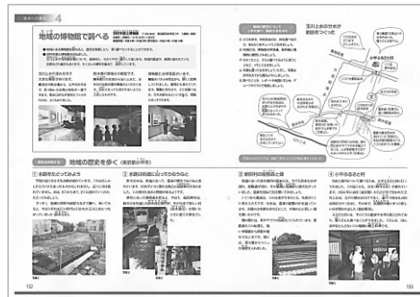
▲地域の歴史を歩く p132~133