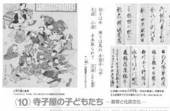
▲5章(10)寺子屋の子どもたち p126~127

指導的な立場の人物だけでなく、さまざまな分野・階層の男女の生活や社会的な業績を具体的に叙述しました。子どもや若者の生き方や労働・学習について取り上げ、生徒の関心と共感をよび起こせるようにしました。