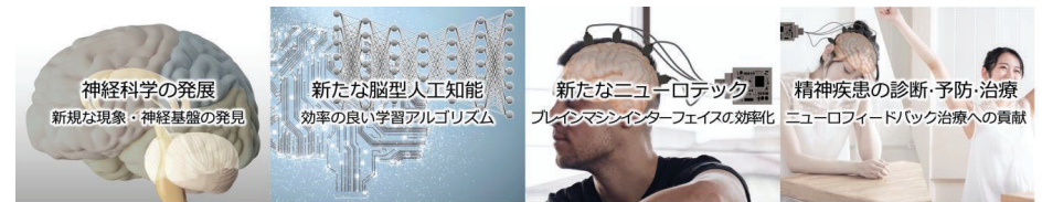
図3 期待される波及効果

予測と行動の統一理論を確立することで、神経回路の計算原理、つまり脳や心の仕組みへの理解が深まり、神経科学全体が進歩するとともに、脳を予測することが可能になります。本領域の成果は、精神疾患の機序解明や早期診断・治療方法の開発、新たなニューロテックの創出、ヒトのように考える脳型人工知能の開発への応用が期待できます（図3）。特にAI応用に関しては、脳の効率的な学習の仕組みを解明することで、既存の手法よりも効率の良い学習アルゴリズムの発見が期待できます。