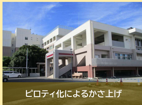
ピロティ化によるかさ上げ