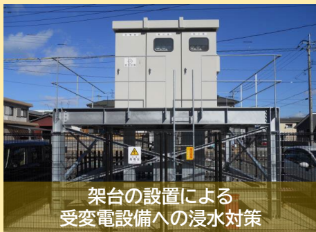
架台の設置による 受変電設備への浸水対策