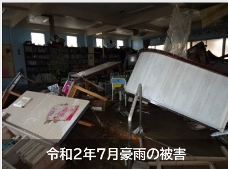
令和2年7月豪雨の被害