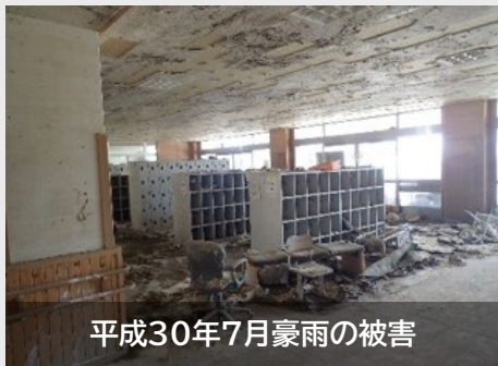
平成30年7月豪雨の被害