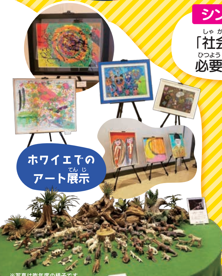
※写真は昨年度の様子です。