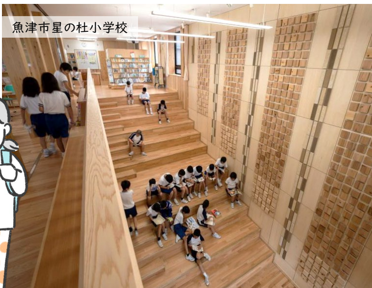
魚津市星の杜小学校