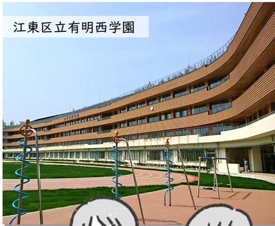
江東区立有明西学園