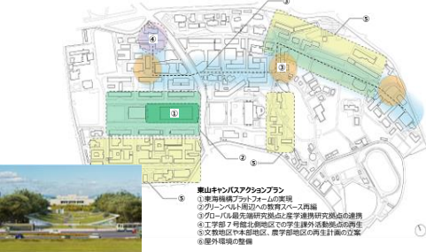
東山キャンパスアクションプラン ① 学術環境アクションプランの充実 ② グリーン化推進と省エネルギー推進 ③ グローバル最先端研究拠点と産学連携研究拠点の連携 ④ 工学部7棟と東山地区の学生生活拠点の連携 ⑤ 文庫地区や本部地区、農学部地区の再生計画の立案 ⑥ 屋外環境の整備