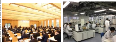
脱炭素社会実現のための共創拠点 多様な交流を促進するオープンラボ