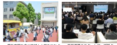
屋外空間も含め地域と大学をつなぐ共創拠点の整備 産学連携のスタートアップ拠点