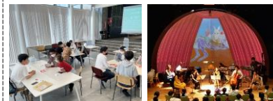
多様な交流を支える国際宿舎 日本文化の研究・発信拠点