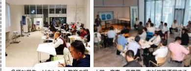
多様な学生・リカレント教育の場 大学・高専・産業界・市が共同運営するコワーキングスペース