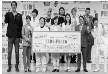
図9-3 春のキッズフェスタ記者会見