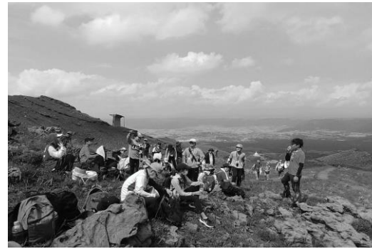
図6-2 教育事業「阿蘇は生きている」