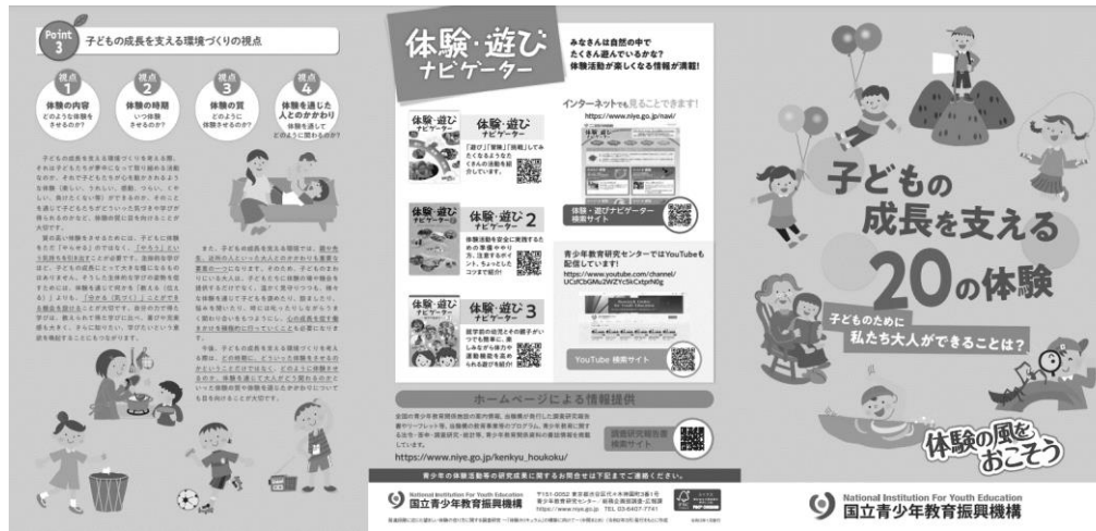
図3-1 冊子「子どもの成長を支える20の体験」

また、令和4年度「未来を拓く子供応援フォーラム」において、「体験の風をおこそう」パンフレットや「子どもの成長を支える20の体験」等の広報資料を配布し、普及・啓発に努めた。