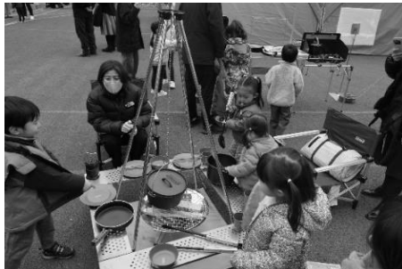
図9-2 TOKYO TAIKEN MARCHE in SHIBUYA

また、地方施設においては、商工会議所や観光協会、まちづくり協議会等の協力を得て施設リーフレット等を配架するとともに、タウン誌や観光マップ、各地のイベント配布物に各施設利用案内や取組について掲載している。そのほか、地元のNPO法人・団体と連携して情報冊子などに施設のイベントを掲載するなど、民間団体の地域への影響力や情報発信力を活用し広報を実施した。