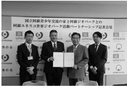
図6-1 連携協定締結式(阿蘇)

阿蘇では、ジオパークを通じた教育や体験活動の強化を図るため、令和4年5月に阿蘇ジオパーク推進協議会と連携協定を締結し、阿蘇の敷地内に同協議会の事務所が設置された。教育事業「阿蘇は生きている～ジオパークの視点でとらえる阿蘇の自然と文化～」に企画段階から同協議会が参画することで、ジオに関する専門的な内容を学ぶ体験学習プログラムが完成し、阿蘇を利用する学校団体へ提供できるようになった。さらに、従前の研修支援プログラムについても、同協議会からのアドバイスを基に内容を刷新し、利用団体にとってより学びのあるプログラムに向上させることができた。また、同協議会を介して様々な関係団体とのネットワークが構築されたことで、小国町の間伐材を活用した杉皿づくりといったSDGsに関する研修支援プログラムを新たに導入することに繋がった。このほか、日ごろから相互の職員が頻繁に交流しており、職員研修にも協力を得ている。こういった相互の連携による取組や事業内容はユネスコに高く評価され、阿蘇ジオパークの世界ジオパーク再認定に寄与することができた。