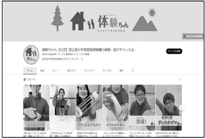
図9-1 YouTubeチャンネル「体験ちゃん」 動画一覧ページ(コンテンツ数 68[令和5年3月現在])

コロナ禍で体験活動も制約される中、家庭で取り組める体験活動を動画で紹介するYouTubeチャンネル「体験ちゃん」を令和3年度に開設し、日常生活の中で実施可能な体験活動の普及啓発に取り組んでいる。令和4年度は、自然体験、文化体験、生活の知恵、科学学習、スポーツ・運動、創作活動など様々なジャンルから「おうちで・家族と一緒に・簡単にチャレンジできる」体験や遊びの紹介動画を年間合計44本配信した。また、令和5年度に開催予定の「春のキッズフェスタ」のPRとして、吉本興業所属の芸人であるゆりやんレトリィバァ氏に「体験ちゃん【春のキッズフェスタ】特別編」へ出演してもらい、効果的にPRを行った。