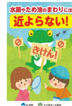
チラシの配布（新潟県）