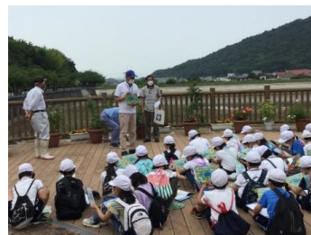
ため池学習の様子