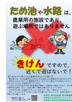
チラシの配布（青森県）