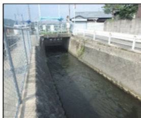
増水時（見た目どおり危険）