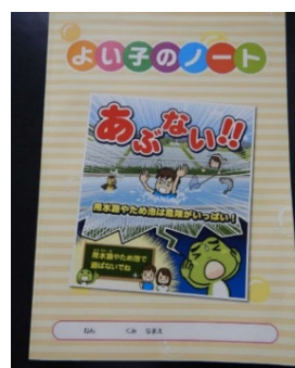
ノートの配布（北海道土地連）