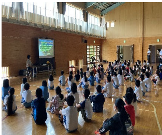
小学校での啓蒙活動