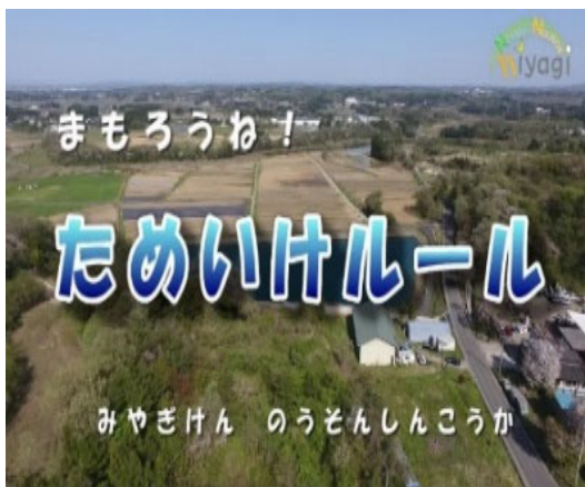
ため池事故防止・注意喚起動画