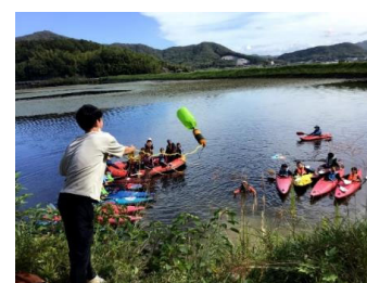
レスキューペットボトル発案