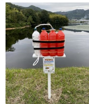
レスキューペットボトル設置