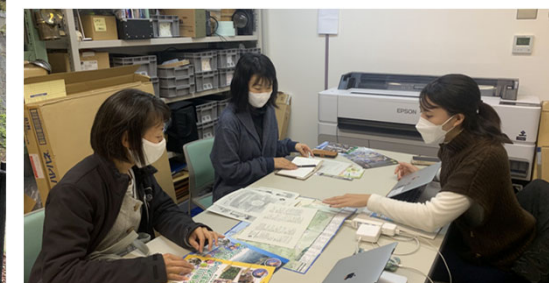
糸魚川ユネスコ世界ジオパーク訪問&取材