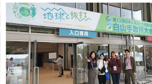
第12回日本ジオパーク全国大会に参加