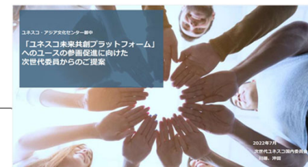
ユネスコ未来共創プラットフォームについてACCUIに提案

他方、ユネスコウィークについては、オンライン形式ということもあり、参加者間の交流や議論の活性化、イベント後のネットワークの広がり等の点で改善の余地が見られた。来年度以降は、対面形式のイベントも活用し、議論の活性化や全国のユネスコ活動に関わるユース世代間の横のつながりを強化を実現したい。