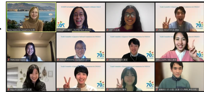
イベント実施後の集合写真