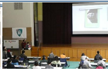
研究発表会の様子