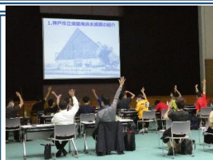
どんどん質問の出る講義