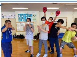
部活動で仲間づくり