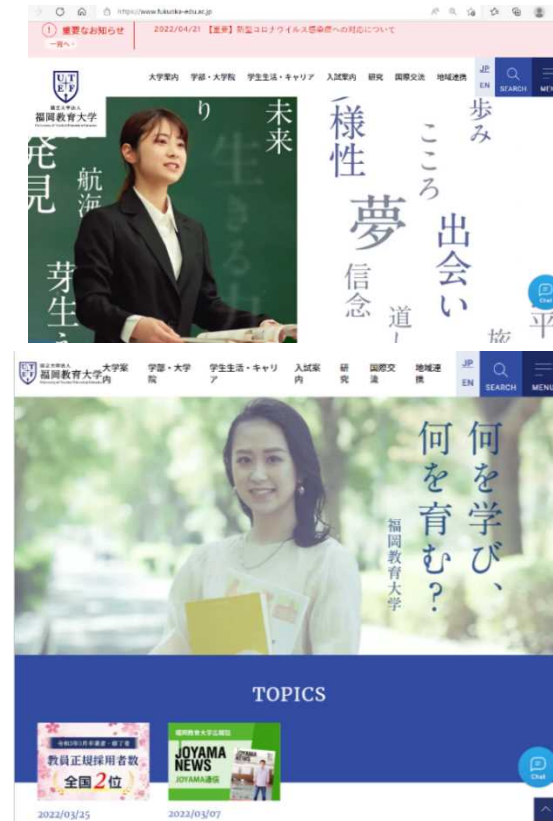
< 福岡教育大学公式 Web サイト

イト「YouTube」動画として掲載し、6,000 回以上視聴されていた（令和3年度末現在）。