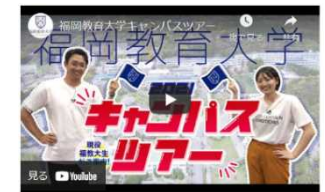
< 同サイト掲載 キャンパスツアー（下）>

○学生の意見を取り入れた広報誌の改善…受験生、保護者の一層の興味を喚起するため、記念号である本学広報誌第50号の特別企画では、令和2年度に学生が相互に支え合うことを目的に発足した学生主体の運営組織「学生支援ネットワーク事務局（COMES Net）」の JOYAMA プロジェクトチームが紙面構成を企画し、 学生目線という新しい視点から、本学の魅力を発信した。