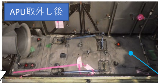
機体上方より見る (APUデッキ)