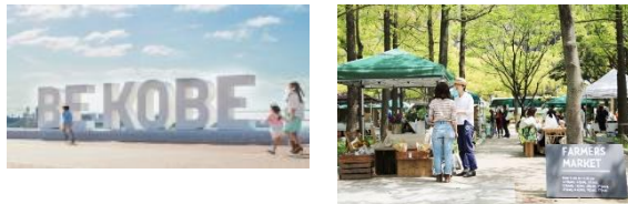
兵庫県神戸市 (2008年、デザイン)