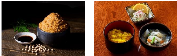
大分県臼杵市 (2021年、食文化)