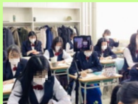
教室と入院生徒を結ぶ授業配信の様子