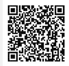
[រីករាយដែលបានស្គាល់! មិត្តពីថ្ងៃនេះ]