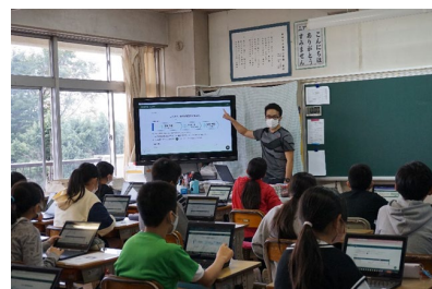
＜CBT実施イメージ＞ 【令和3年度試行・検証より】