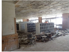
平成30年7月豪雨の被害