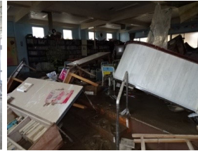
令和2年7月豪雨の被害