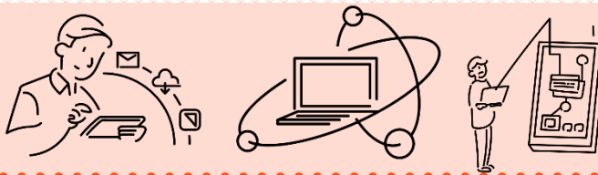
基盤の構築のためには 先端研究が必要

サイバーとフィジカルが融合するSociety 5.0を実現させるとともに、半導体等要素技術の抜本的な革新にも対応できるよう、新たなイノベーションの起爆剤となる最先端の情報科学技術（AIやビッグデータ、IoT、ソフトウェア、システム等）に関する研究開発を推進し、情報科学による実社会の課題解決を図ることで、社会変革と経済成長を加速する。