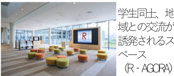
学生同士、地域との交流が誘発されるスペース (R-AGORA)

【立命館大学大槻いばらきキャンパス】 ・「アジアのゲートウェイ」「都市共創」「地域・社会連携」がコンセプト ・地域・社会に開かれたキャンパス作りで地域住民との交流が活発