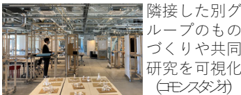
隣接した別グループのものづくりや共同研究を可視化 (commons 対外)

【千葉大学墨田キャンパス】 ・「街と一体となったキャンパスをつくる」という基本構想の下、生活の全てのシミュレートに基づき分野横断的な教育研究を展開 ・地元企業等と共同研究を活発に行うことができる環境を整備