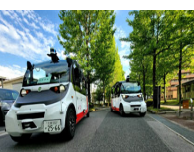
電気自動車の自動運転の実証実験をキャンパス内道路を活用して実施

【広島大学東広島キャンパス】 ・地元自治体や企業と Society5.0 やスマートシティの実現に関する包括連携協定の締結 ・キャンパスを自治体・企業・地域住民等との共創拠点として産学連携や実証実験を推進