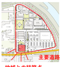
地域との結節点となる施設配置とし、地域社会との繋がり役割を担う (KYOAI GLOBAL GATEWAY) 主要道路 地域との結節点

【共愛学園前橋国際大学】 ・「地学一体」となった人材育成を目的とした教育を展開 ・「めぶく。プラットフォーム前橋」を設立し、地域課題を議論