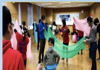
超参加型音楽イベントの様子♪

MLAPの動画です♪みんなで楽しんでください♪感想は是非 hogsha@fiku.jp へ♪