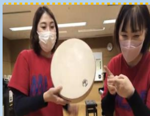
配信した動画の一場面