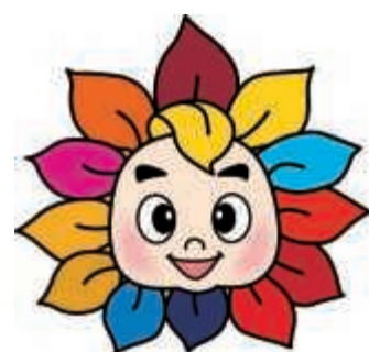
兵庫県弁護士会イメージキャラクター ヒマリオン Since2001