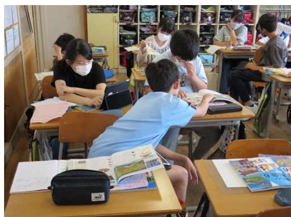
(単元内自由進度学習)