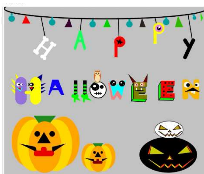
作成したプロトタイプ

全国の多様な学校群と連携し、STEAM 教育としてアートや遊びの要素を取り入れつつコンセプトを深掘りしながら、生徒の探究的な学びを支援する取組が行われている。新しいリテラシーや探究的な学びに関する教員研修、教材、コンセプトシート、メンターとなる学生や専門家、他の学校や企業・大学との連携、発表の場などを総合的に提供することで、ワクワクや素直な声を引き出し、コンセプトを磨き、形にしている。例えば生徒は、まずはロボットで遊びながらセンサーや機構の基本を学ぶが、徐々に身の回りの課題と結びつけて考え始める。自らが考えたコンセプトで五感を使い、社会的な課題解決に取り組む中で、価値を創造する可能性と喜びを実感し、主体的に行動するようになった。特別支援学校やこども園なども属する多様な探究ネットワークの中で、フラットで創造的な連携も生まれている。