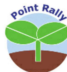
学びのポイントラリー

自治体や市民団体、NPO、大学、地域の施設、地元の民間企業等が実施する様々な教育プログラムを、民間団体がまとめて広報し、地域での学びの場への参加を促す取組が行われている（地域の学び推進機構 学びのポイントラリー 23 ）。登録プログラムは、市民生活、文化生活、職業生活、教科学習の補充・発展という4種からなり、児童生徒は参加すると時数に応じたポイントが得られる。さらに、一定のポイントまで達するごとに参加を証明する「認定証」の発行を機構から受けることができる。教育プログラムが一覧化されて機構のホームページや学校を通じて広報されることにより、児童生徒は、興味関心に応じて幅広いプログラムから選びやすくなる。教育委員会等の後援も受けながら、平成30年3月現在、全国11の地域で実施されている。